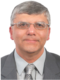
وكيل الكلية لشئون الدراسات العليا والبحوث

وختاماً فإن جهود السادة اعضاء هيئة التدريس بالكلية للنهوض بالعملية التدريسية والبحثية والتطبيقية تتجه إلى التطوير المستمر لمستوى الاداء وزيادة الإمكانيات البحثية والمعملية والمكتبية لتحقيق الفائدة المرجوة من الدراسات العليا وربطها بالاحتياجات البحثية للمجتمع، كما تعمل إدارة الدراسات العليا بالكلية جاهدة على أداء دورها فى خدمة ومتابعة شئون ومتطلبات الدراسات العليا بالكلية.